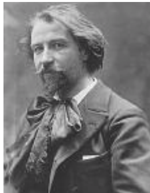
Gustave Charpentier 1860 - 1956

Le SAMUP : Le Syndicat des Artistes MUSiciens de Paris fut fondé le 13 mai 1901 par Gustave Charpentier. Son président d'honneur est Pierre Boulez.