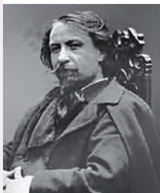
Gustave Charpentier 1860 - 1956

Le SAMUP : Le Syndicat des Artistes MUSiciens de Paris fut fondé le 13 mai 1901 par Gustave Charpentier. Son président d'honneur est Pierre Boulez.